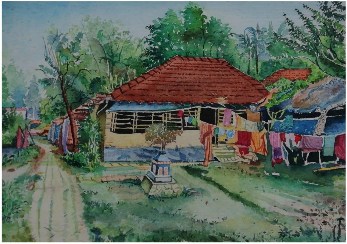
TITLE - VILLAGE MEDIUM - WATER COLOUR SIZE - 12X 16 INCH