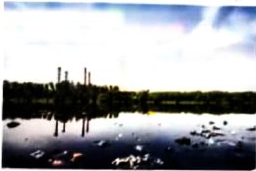
Forest by lake